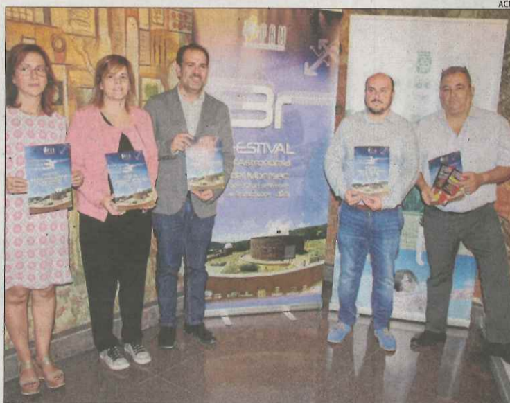
Moment de la presentació del festival, ahir, a la Diputació.

Els impulsors pretenen duplicar el nombre de visitants i arribar als 3.000. Per aconse-